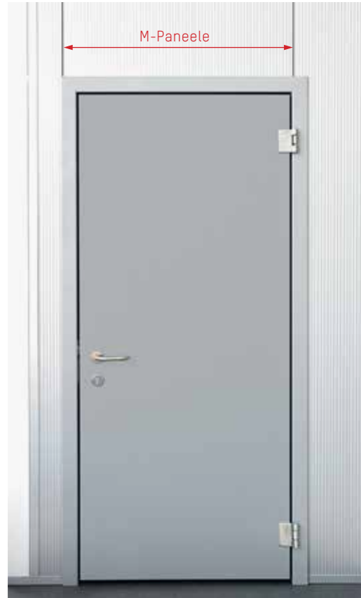
Maße: 850 x 2.100 mm