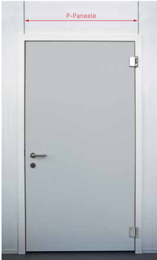
Maße: 1.030 x 2.100 mm