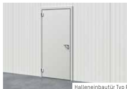
Halleneinbautür Typ P

Als Ergänzung zu den Dämmpaneelen Typ P erhalten Sie bei ROMA auf Wunsch auch die geeignete Einbautür. Da die Breite der Tür perfekt zur Breite der vertikal verlegten Paneele passt, ist die Montage unkompliziert und ohne Verschnitt. Sparen Sie sich dort, wo die Türöffnung platziert werden soll, 2,5m 2 Paneelfläche und setzen einfach die Tür dafür ein. Mehr Informationen zu dieser praktischen Lösung finden Sie in unserem Prospekt „Halleneinbautür“.