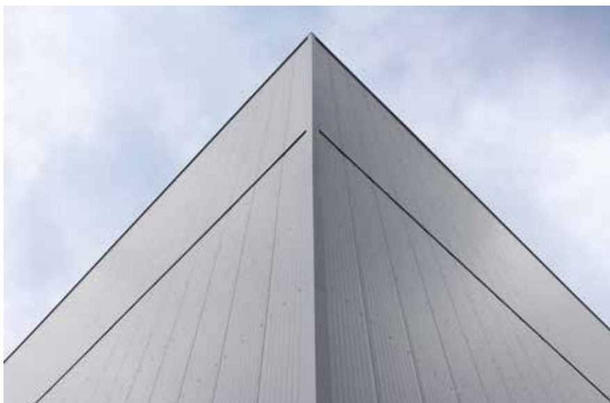
Hochregallager mit vertikaler Verlegung.

Last, but not least: Wirtschaftlichkeit und überzeugende Optik lassen sich mit ROMA bestens verbinden. Eine große Auswahl an Materialien, Oberflächen und Farbtönen ermöglicht eine hochwertige Gestaltung Ihres Bauobjekts.