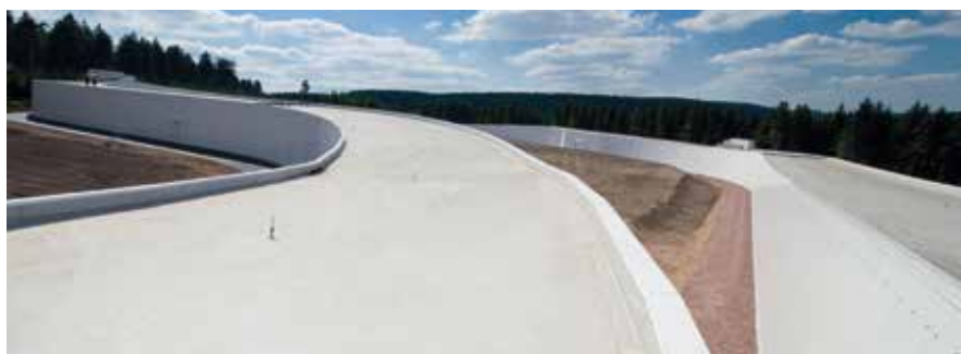
Differenzierte Gebäudeformen mit ROMA Schnellbau-Dämmpaneel (Skihalle Oberhof)